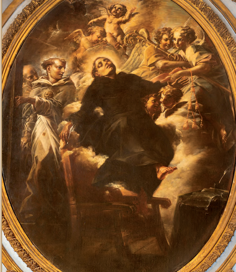
Biagio Puccini, Ekstase des hl. Bonaventura (1708). San Paolo alla Regola, Rom

Werks Itinerarium mentis in Deum vorschlägt: „Wenn ihr fragt, wie diese Dinge geschehen, fragt nach der Gnade, nicht nach der Belehrung, nicht nach dem Verstehen ... nicht nach dem Licht, sondern nach dem Feuer, das uns völlig entflammt und uns in Gott hineinführt.“ ( Itinerarium VII 6).